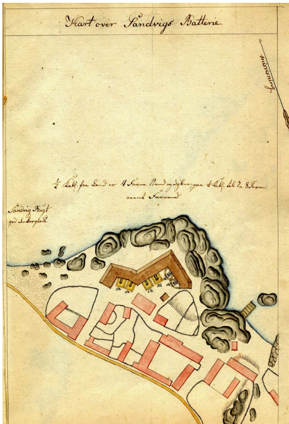
Sandvig Batteri ca. 1810 – Bornholms Museum