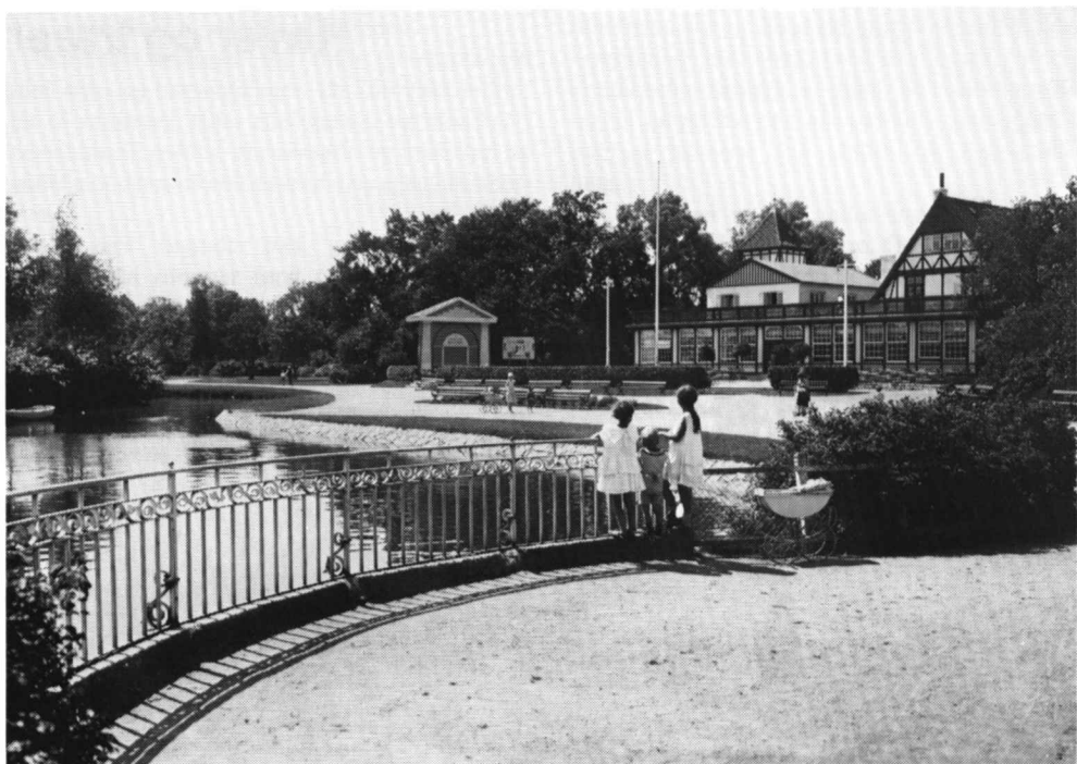
Lystanlæg med promenadestier, svanesø og klippede hække. (Slagelse. Det kgl. Bibliotek. 1926).

et udendørs supplement til klubberne og de selskabelige foreninger.