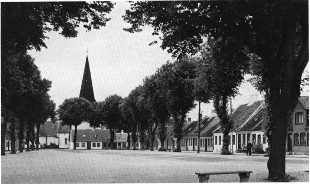
Pladsens form fremhæves af trærækkerne, som giver torvet en monumentalitet, de beskedne huse ikke alene formaar. (Bogense 1956. Niels Elswing).

Man har indtryk af, at landevejens træer er fulgt med ind i byen, da byportene blev sløjft, men en egentlig planlagt træbeplantning i gaderne er der ikke tradition for.