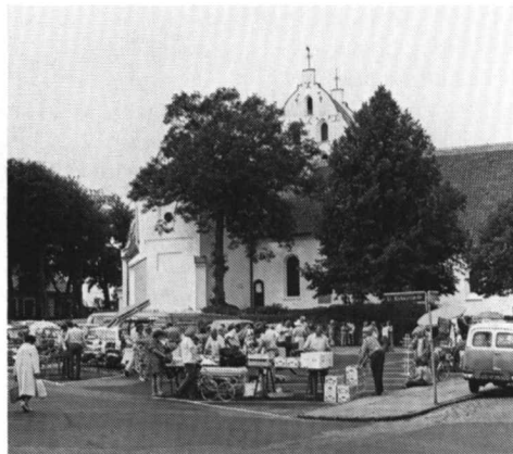
Kirkepladsens træer syner videnom. Handel ved Sci. Cathrine kirke, Hjørring.